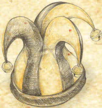
Bozzetto: Daniele Andrioli

Ecco allora delineato il profilo di un personaggio dalla natura ribelle e dal costume libertino, dedito all'ironia, allo scherzo, all'insolenza (un goliarda, per l'appunto), oppositore del moralismo austero della Chiesa, votato ai piaceri dell'amore, del gioco e del vino, il quale opera presso pubblici di estrazione varissima (da quella popolare a quella cortigiana) esercitando la propria arte di cantastorie, di saltimbanco, di buffone, di giocoliere, di musico o di poeta.